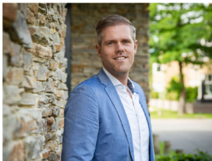
NVM Makelaar-Taxateur o.z.