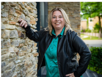
Commerciële binnendienst medewerkster