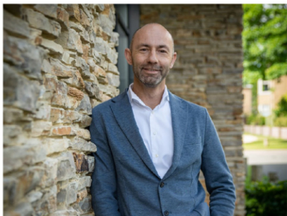
NVM Makelaar-Taxateur o.z.

Omdat we de kracht en kennis in huis hebben